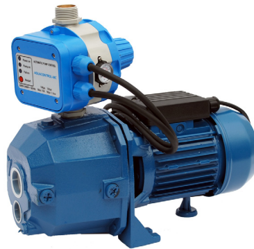
GP - DJ/AQUACONTROL-MC