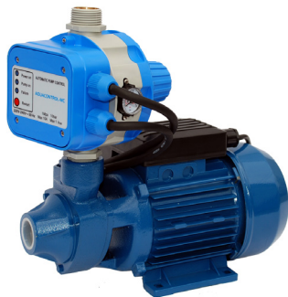
GP - PE/AQUACONTROL-MC