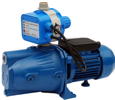
GP - JET/AQUACONTROL-MC

Groupes de pression appropriés pour demeures domestiques et irrigation par aspersion.