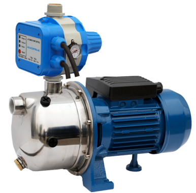
GP - JETINOX/AQUACONTROL-MC