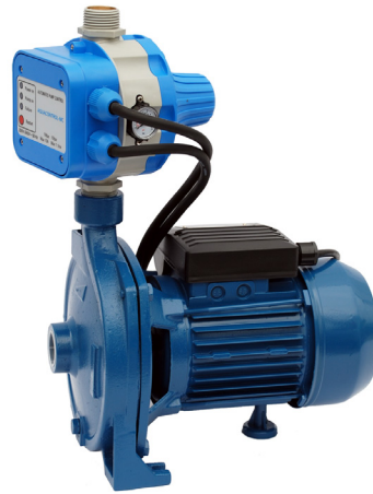
GP - CM/AQUACONTROL-MC