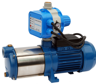
GP - BM/AQUACONTROL-MC