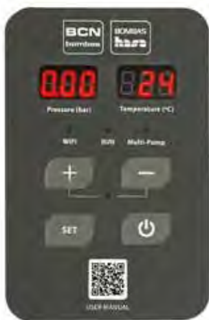
Display LCD con indicador de presión y temperatura del agua. LCD display with water temperature and pressure indicator. Écran LCD avec indicateur de pression et de température de l'eau.