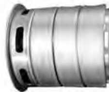
Todas las piezas en contacto con el agua en acero inoxidable. All parts in contact with water are in stainless steel. Tous les pièces en contact avec l'eau sont en acier inoxydable.