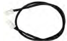
Cable de comunicación para conexión en paralelo de 2 bombas. Communication cable for parallel connection of 2 pumps. Câble de communication pour la connexion en parallèle de 2 pompes.