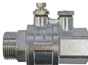
Se incluye válvula de retención para instalar en la aspiración, la cual es imprescindible para el correcto funcionamiento y purgado del grupo de presión. A check valve is included for installation on the suction, which is essential for the correct operation and purging of the booster. Un clapet anti-retour est inclus à installer sur l'aspiration, indispensable au bon fonctionnement et à l'amorçage du surpresseur.