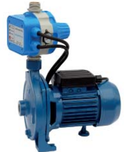
GP - CM/AQUACONTROL-MC