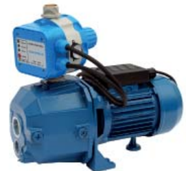
GP - DJ/AQUACONTROL-MC