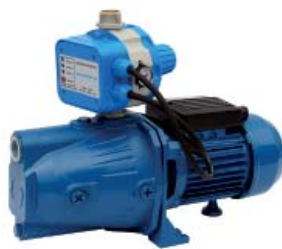
GP - JET/AQUACONTROL-MC