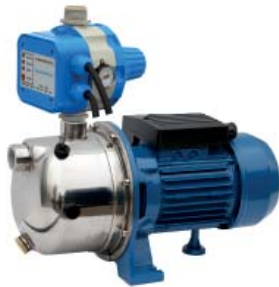
GP - JETINOX/AQUACONTROL-MC