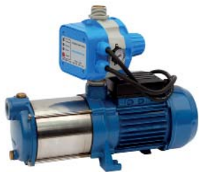
GP - BM/AQUACONTROL-MC