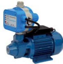
GP - PE/AQUACONTROL-MC